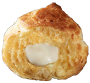
EMMENTAL CHEESE BITES GOUGÈRES EMENTAL CŒUR FONDANT EMENTAL