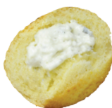
GARLIC & CHEESE BRIOCHES MINI BRIOCHES AIL FINES HERBES