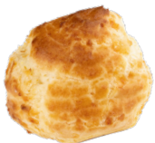
EMMENTAL CHEESE PUFFS GOUGÈRES EMENTAL