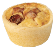
HAM & CHEESE MINI QUICHES MINI QUICHES LORRAINE