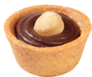
COCOA & HAZELNUT TARTLET TARTELETTE CHOCOLAT NOISETTES