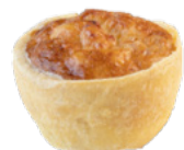
3 CHEESE MINI QUICHES MINI QUICHES 3 FROMAGES