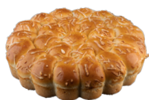
GARLIC & CHEESE BRIOCHE DAMIER BRIOCHÉ AIL FINES HERBES