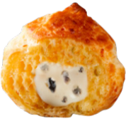
TRUFFLE & BRIE CHEESE BITES GOUGÈRES EMENTAL CŒUR FONDANT BRIE TRUFFE