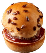
MINI CHEESEBURGERS MINI CHEESEBURGERS