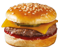
CHEESEBURGERS BURGERS BŒUF CHEDDAR