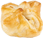
SCALLOPS PUFF PASTRIES MINI PANIERS SAINT-JACQUES