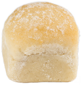
GARLIC BREAD BITES PREFOU COCKTAIL AIL PERSIL