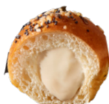
EMMENTAL CHEESE BRIOCHES BRIOCHETTES EMMENTAL