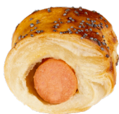
PORK & MUSTARD SAUSAGE ROLLS SAUCISSES COSTUMÉES MOUTARDE