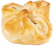
BRIE CHEESE PUFF PASTRIES MINI PANIERS BRIE