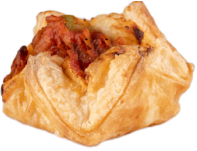
TOMATOES & OLIVES PUFF PASTRIES MINI PANIERS TOMATES OLIVES