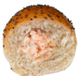
SALMON BRIOCHES BRIOCHETTES SAUMON