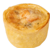
SALMON & LEEK MINI QUICHES MINI QUICHES SAUMON POIREAU