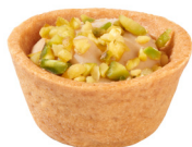
HAZELNUT & PISTACHIO TARTLET TARTELETTE PRALINE PISTACHES