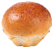
RASPBERRY BRIOCHE BRIOCHE FRAMBOISE