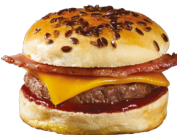
MINI BACON BURGERS MINI BURGERS BACON